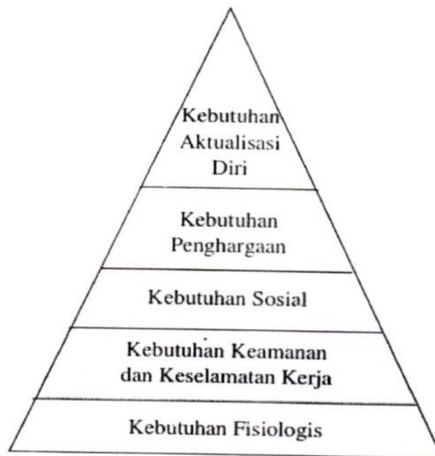
Gambar 1. Hirarki Kebutuhan Maslow (Robbins dan Judge, 2008)

Maslow mengasumsikan bahwa orang berusaha memenuhi kebutuhan yang lebih pokok ( fisiologis ) sebelum mengarahkan perilaku kearah kebutuhan yang paling tinggi ( self actualization ). Apabila kebutuhan seseorang (mahasiswa atau pengurus) sangat kuat, maka semakin kuat pula motivasi orang tersebut menggunakan perilaku yang mengarah pada pemuasan kebutuhannya.