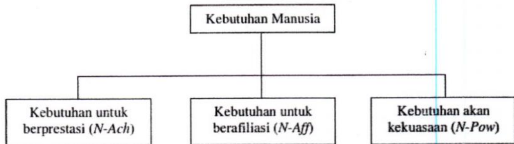
Gambar 2. Teori Kebutuhan McClelland (Ernie Trisnawati S., 2005)

Faktor motivasi menurut Santrock (dalam Safitri, 2011: 19) yaitu: